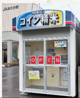
新座支店 コイン精米機 住所：新座市本多1-11-1 営業時間：24時間営業