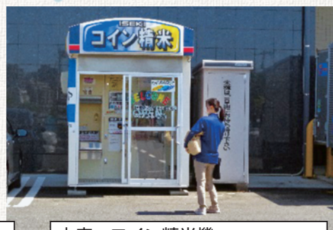
本店 コイン精米機 住所：朝霞市大字溝沼466番地 営業時間：24時間営業