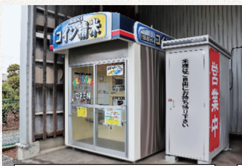
野火止支店 コイン精米機 住所：新座市野火止5-7-22 営業時間：24時間営業

志木支店コイン精米機が4月28日（木）よりオープン致しました。既に稼働している野火止支店、新座支店、本店に続いてのオープンとなります。 10kg100円から精米を行うことができ、初めて精米機をご利用になれる方でも手軽に精米をすることが出来ます。 ご利用お待ちしております。 ※志木支店のコイン精米機営業時間は、他の店舗と異なり8:00～20:00となっておりますので、予めご了承ください。