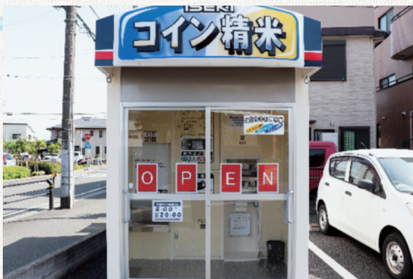
志木支店 コイン精米機 住所：志木市中宗岡1-4-41

志木支店コイン精米機が4月28日（木）よりオープン致しました。既に稼働している野火止支店、新座支店、本店に続いてのオープンとなります。 10kg100円から精米を行うことができ、初めて精米機をご利用になれる方でも手軽に精米をすることが出来ます。 ご利用お待ちしております。 ※志木支店のコイン精米機営業時間は、他の店舗と異なり8:00～20:00となっておりますので、予めご了承ください。