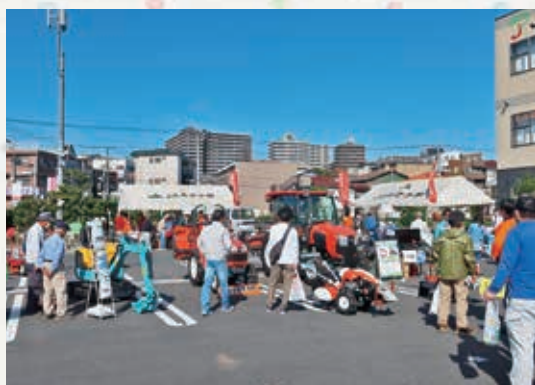
多くの来場者で賑わいました

11月3日（祝日）、本店駐車場において農機展示会を開きました。当初は9月開催を予定していましたが新型コロナウイルスの影響を受け延期となっていました。 今回は組合員からの強い要望を受けコロナ対策を徹底しながら行い100名を超える来場がありました。当日は各農機メーカーのトラクターや管理機など組合員ニーズに合わせた農業機械を数多く取り揃え、同時に肥料・農薬などの相談コーナーも設置しました。 また、ドローンの実演が行われ、実際に飛行し散布する様子を見学することができました。来場者は「ドローンが飛ぶところを初めて見れて良かった。結構大きさもあったがスムーズに離陸し飛行している様子は迫力満点だった。」と話していました。