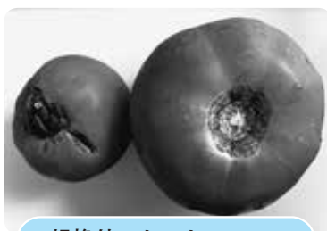
規格外のトマト

決められた大きさや形から外れた野菜は「規格外」と呼ばれ、流通させることができません。でも形も大きさもバラバラなのが自然の姿。例えば、野菜宅配の「大地を守る会」では「もったいナイシリーズ」として規格外の農産物が販売され、野菜販売サイトの「みためとあじはちがう店」では、規格外青果物を箱詰めして大田市場から直送しています。コロナ禍で「ポケットマルシェ」や「食べチョク」など、規格外を含めて生産者から直接購入できるサイトが大人気になりました。