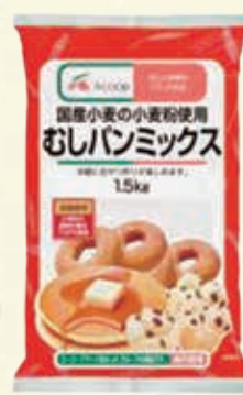
むしパンミックス 1.5kg 770円