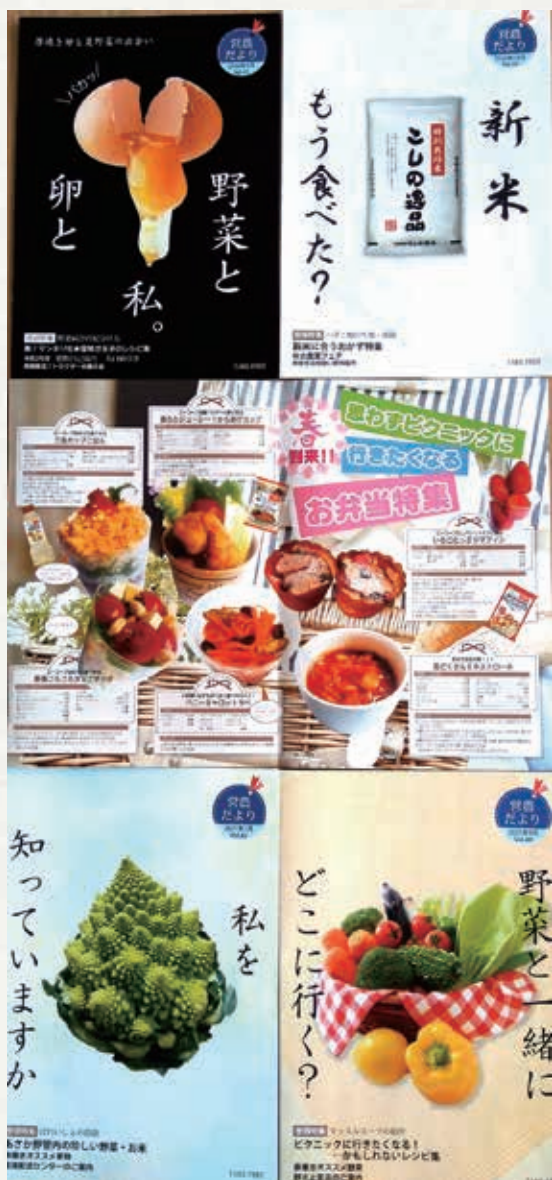
お弁当特集を掲載した「宮農だより」

季刊発行している宮農だより4月号に「エーコープマーク誕生50周年キャンペーン」にちなんだエーコープ商品を使用したレシピで作ったお弁当を掲載しました。ほめられ酢で作る三色カップごはんは酢飯の上に炒り卵・水菜・鶏そぼろを盛った色鮮やかなカップごはん、からあげカップは塩こしょうパウダーで素材の旨味を引き出しました。またデザートのにちごたつぷりマフィンには、ロングラン商品のむしパンミックスを使用しました。コロナ禍で、外出が制限されている中、ピクニックに持って行けるようにカップにして手軽さを出しました。現在、支店内の経済コーナーでは「国産こだわり宣言 安全・安心、しかもおいしい！エーコープマーク品」の横断幕を掲示し、更に品揃えを増やして販売をしています。 今後はエーコープマーク品フェアの開催、農産物直売センターや経済配送センターでも販売を強化していきます。