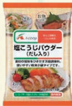
塩こうじパウダー 72g(12g×6袋) 240円