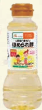
ほめられ酢 300ml 260円

季刊発行している宮農だより4月号に「エーコープマーク誕生50周年キャンペーン」にちなんだエーコープ商品を使用したレシピで作ったお弁当を掲載しました。ほめられ酢で作る三色カップごはんは酢飯の上に炒り卵・水菜・鶏そぼろを盛った色鮮やかなカップごはん、からあげカップは塩こしょうパウダーで素材の旨味を引き出しました。またデザートのにちごたつぷりマフィンには、ロングラン商品のむしパンミックスを使用しました。コロナ禍で、外出が制限されている中、ピクニックに持って行けるようにカップにして手軽さを出しました。現在、支店内の経済コーナーでは「国産こだわり宣言 安全・安心、しかもおいしい！エーコープマーク品」の横断幕を掲示し、更に品揃えを増やして販売をしています。 今後はエーコープマーク品フェアの開催、農産物直売センターや経済配送センターでも販売を強化していきます。