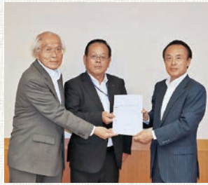
朝霞市 富岡勝則市長(右)