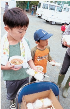
おにぎり早く食べたいな！