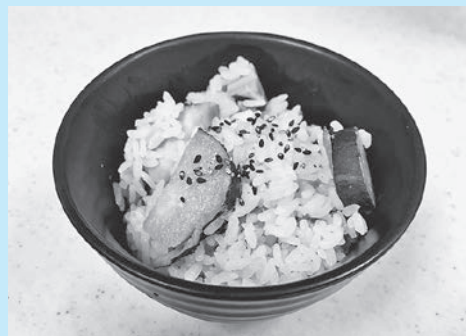
『ごろごろさつまいもご飯』

お芋が美味しい季節がやってきました！ 今月は地場産のあま～いさつまいもを使った炊き込みご飯を作ります！ さつまいもにはビタミンC、E、食物繊維が豊富に含まれており美容と健康に効果的です。 ちなみに風邪の予防にはさつまいもとβ-カロテン、ビタミンB 12 が豊富なブロッコリーとの食べ合わせが効果的。 ぜひ直売所にお越しください～。