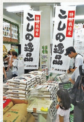
こしの逸品 好評販売中！