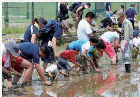
一生懸命田植えする参加者

5月11日（土）、志木市秋ヶ瀬スポーツセンター付近の荒川河川敷にある田んぼで、志木支店管内の組合員で構成される宗岡コシヒカリクラブの方々为主体となり、志木市、JAあさか野が連携し、「田んぼ体験ツアー」を開催しました。 今年は昨年度より多い52組190人が参加しました。参加者は、宗岡コシヒカリクラブの方々の指導に従い、稲を片手に田んぼに入り親子で楽しみながら田植えを行いました。 参加した子供たちは、「本当にお米ができるの？できたらおにぎりにして食べたい。」と話していました。今後は9月に稲刈を行う予定です。