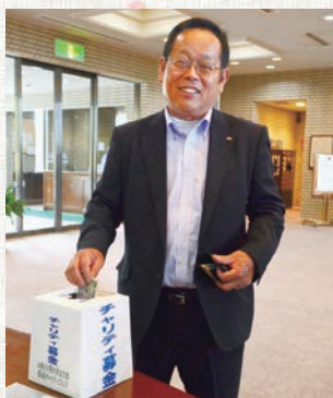
たくさんの募金 ありがとうございます。

5月15日（水）、JAあさか野共済友の会第9回チャリティゴルフ大会が、「石坂ゴルフ倶楽部」にて、59名の会員が参加し開催されました。 チャリティ募金は、会員の皆様にご協力いただき、79,000円となりました。この募金は、JA共済連埼玉を通じて一般財団法人埼玉県農協福祉事業団へ寄付させていただきました。