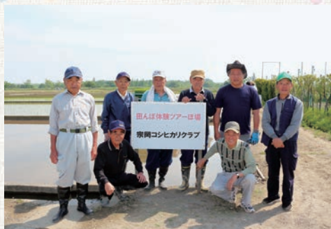
宗岡コシヒカリクラブの方々

5月11日（土）、志木市秋ヶ瀬スポーツセンター付近の荒川河川敷にある田んぼで、志木支店管内の組合員で構成される宗岡コシヒカリクラブの方々为主体となり、志木市、JAあさか野が連携し、「田んぼ体験ツアー」を開催しました。 今年は昨年度より多い52組190人が参加しました。参加者は、宗岡コシヒカリクラブの方々の指導に従い、稲を片手に田んぼに入り親子で楽しみながら田植えを行いました。 参加した子供たちは、「本当にお米ができるの？できたらおにぎりにして食べたい。」と話していました。今後は9月に稲刈を行う予定です。