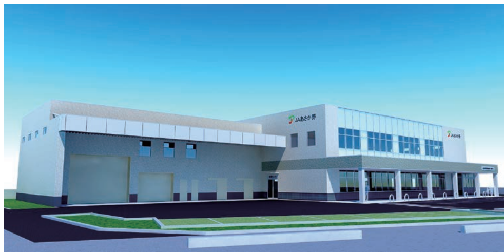
新座支店完成イメージ図

※新座支店のA T Mは、令和元年8月13日（火）午前8時より稼働、窓口は午前9時より営業します。