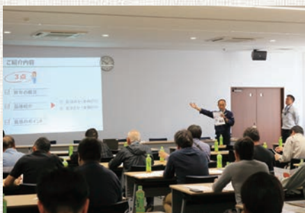
真剣に説明を聞く生産者ら

5月15日(水)、本店会議室にて、住化農業資材、サカタのタネ、横浜植木のメーカー三社を迎え、管内の生産者42名が参加し、「にんじん」の栽培における説明会を開催しました。 当JA管内の「にんじん」の生産量は埼玉県内でも上位に位置する主要な作物で、栽培についてS-GAPの推進など改めて確認する機会となり、各メーカーから「愛紅」「紅ひなた」「ベータリッチ」などの定番品種から新種にんじんの特性・特徴や栽培について説明を受けました。生産者らは、次期栽培に向けて、どの品種が最適なのか真剣にメーカーの話に耳を傾けていました。 今後も野菜栽培における説明会を予定しています。