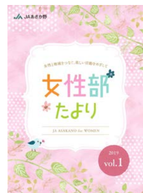
女性部たより第一号発行