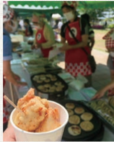
(新座)女性部野火止支部「おやき」「から揚げ」