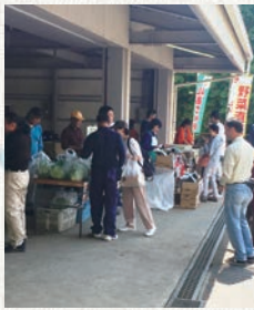
(和光)特価春キャベツ