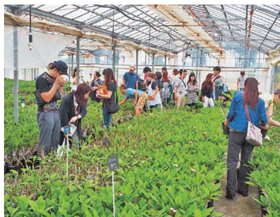
サイタマプルメリアフェスティバル 2019 多くの来場者で賑わうハウス