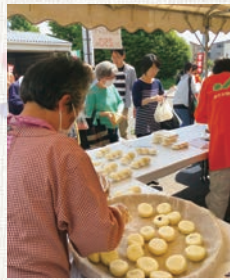
女性部和光支部「田舎まんじゅう」

5月11日(土)、和光農産物直売センターにて、春の収穫祭を開催しました。春キャベツを特価80円で販売したほか、旬の野菜や良質な苗の販売をしました。また、女性部和光支部による大人気「田舎まんじゅう」の販売、来場者へ「フランクフルト」を無料配布し、多くの来場者で賑わいました。同日行われた新座市野火止公民館まつりでは、新鮮野菜販売のほか、女性部野火止支部による「おやき」「から揚げ」の販売が行われました。