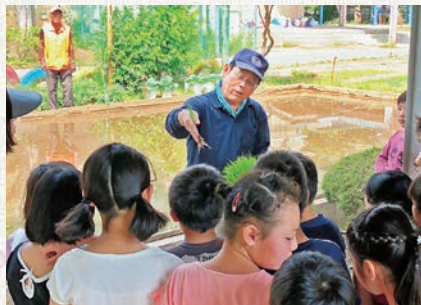
池田組合長による指導