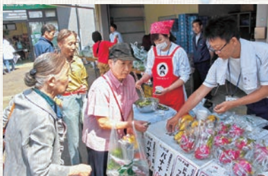
JA改革推進課による試食販売