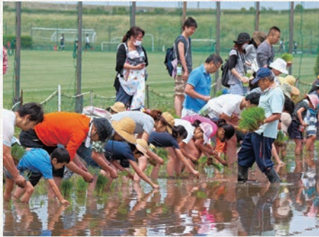
みんな上手に植えました

家族でこの企画に参加するのが楽しかったと語る参加者は、「今は体験できることが少ないので、このような企画は非常にうれしい。子供たちにいい経験ができ、農家の方には感謝している。」と話していました。