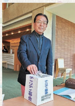
たくさんの募金ありがとうございます。

5月11日（金）、JAあさか野共済友の会 第8回チャリティゴルフ大会が、「高坂カントリークラブ」にて、64名の会員が参加し開催されました。この大会は会員同士の親睦と健康増進のため毎年行われております。天候にも恵まれ、心地よくプレーを楽しんでいました。