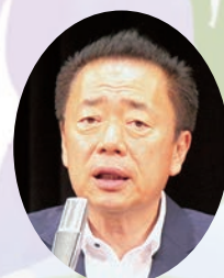
新座市長 並木 傑 様