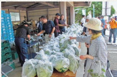
春キャベツを買い求める来場者

5月12日（土）、和光農産物直売センターにて、春の収穫祭を開催しました。地元生産者が採れたての春キャベツを特価販売したほか旬の野菜を販売しました。