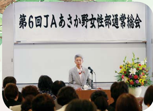
第6回JAあさか野女性部通常総会

議長に渡邊女性部長が選出され議事に入り、第1号議案「平成29年度活動報告書並びに収支決算書