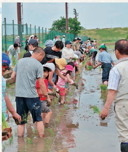
教わりながら苗を植えていく参加者

5月14日（土）、志木市秋ヶ瀬スポーツセンター付近の田んぼにて「田んぼ体験ツアー」が開催され、24組89名が参加しました。このツアーは今回おこなわれた田植えから始まり、6月にかかし作り・9月に稲刈りと収穫の農作業を体験する予定です。 この取り組みは宗岡コシヒカリクラブが主体となり、田んぼ10アールを使って、志木市・さいたま農林振興センター・JAあさか野の協力のもとおこなわれています。 参加者は、「初めての田植え体験を、子どもと楽しくできて良かったです。かかし作りが楽しみです」と話してくれました。