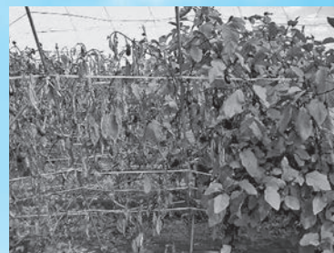
ナス青枯病発病株(左)

※当センターや農協TACに問い合わせをされる時にも、上記の点を事前にチェックして頂くと、早期の原因究明に繋がります。