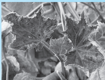
きゅうりモザイク病発病葉