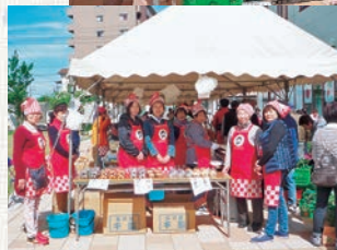
女性部野寺支部のお団子は大好評