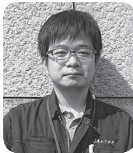
梶 原 野

志木支店におりますので、営農相談はもちろん、営農相談以外でも気軽にお声掛けください。