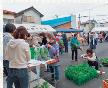
万願寺唐辛子のような「大型シシトウ」の苗も販売されました