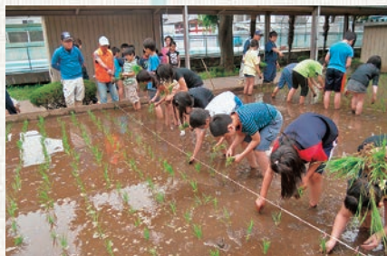
楽しく田植えをする児童